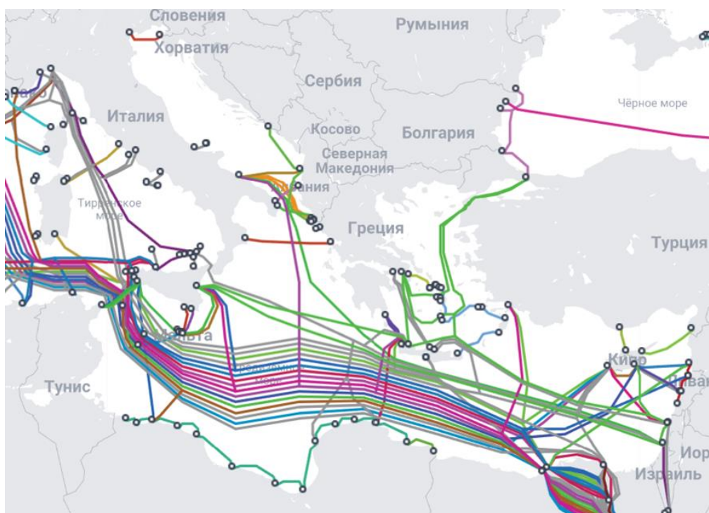
Рис. 4. Подводные кабели Восточного Средиземноморья.