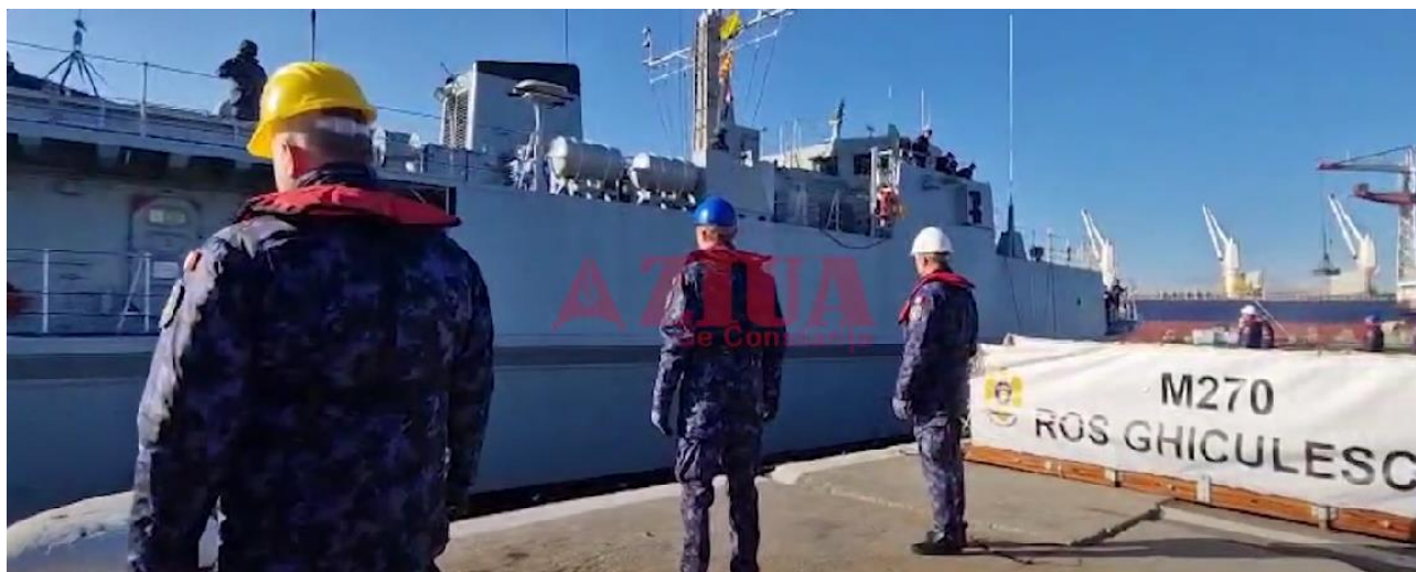
Рис. 1. Прибытие корабля ROS Ghiculescu в Румынию. Констанца. 19.12.2023.