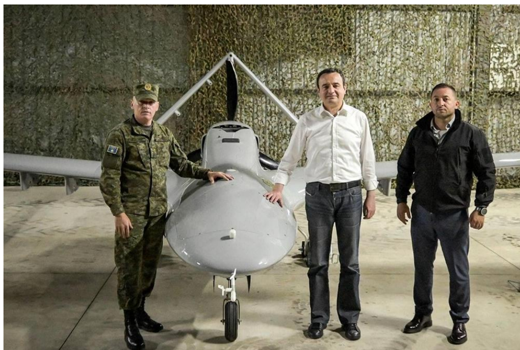
Рис. 2. Альбин Курти и беспилотники Bayraktar TB2 . Приштина. Июнь 2023 г.

В географическом отношении нужно отметить, что строительство подлодок, как и кораблей других типов, осуществляется на верфи Гёльджюк ( Gölcük Naval Shipyard ) в Измитском заливе Мраморного моря. Не менее важным объектом являются верфи Седеф, где 10 апреля 2023 г. был спущен на воду авианесущий десантный корабль TCG Anadolu , построенный турецко-испанским консорциумом Sedef-Navantia (на основе проекта испанского десантного корабля Juan Carlos I ). Активное развитие турецкого военно-морского флота повышает значение острова Лемнос, где вероятно размещение одной из военных баз США в ближайшие годы – в соответствии с Соглашением о военном партнерства 2021 г. (см. ч.3, раздел «США»).