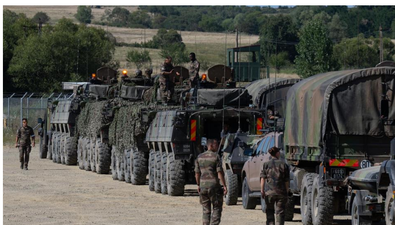
Рис. 3. Подготовка перехода в рамках учений Deployex . Румыния, август 2023 г.